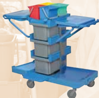
CHARIOT LIVRE SANS SAC (à commander séparément)