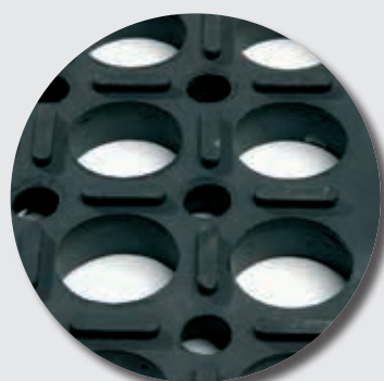
Face inférieure M24