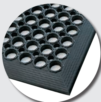
Face supérieure M24